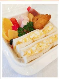
キッズBOX 594 円