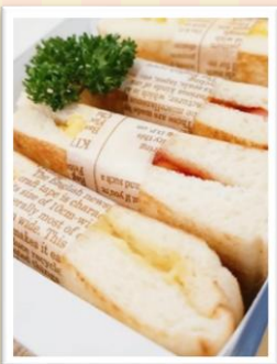
ホットサンドBOX 842 円