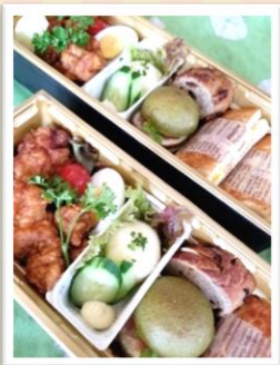
サンドウィッチ弁当 1,404 円